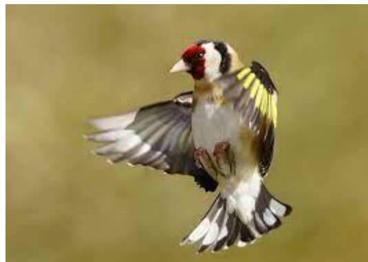
PHOTO de l' Oiseau

definition 5 Animal (vertébré à sang chaud) au corps recouvert de plumes, dont les membres antérieurs sont des ailes et qui a un bec.