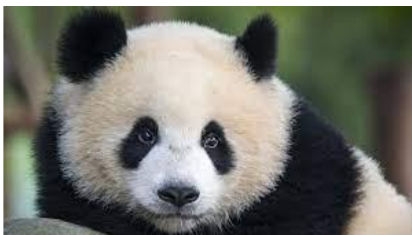
PHOTO du Panda

definition 6 Panda qui a la taille d'un gros chat, qui possède une fourrure épaisse, rousse, brillante, qui vit dans les arbres, qui se nourrit de fruits, d'herbes