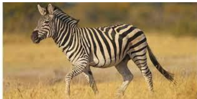
PHOTO du Zèbre

definition 8 Équidé d'Afrique, voisin de l'âne, à la robe rayée de bandes noires ou brunes, au galop très rapide