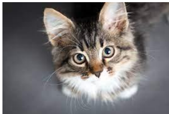
PHOTO du Chat

definition 1 Petit mammifère familier à poil doux, aux yeux oblongs et brillants, à oreilles triangulaires, aux griffes rétractiles.