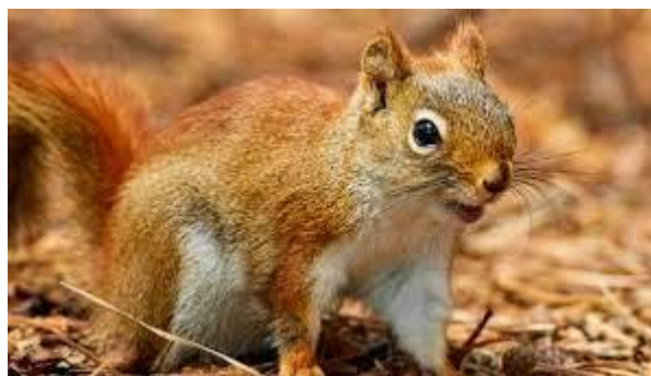
PHOTO de l' Ecureuil

definition 3 Petit mammifère rongeur au pelage généralement roux, à la queue longue et en panache.