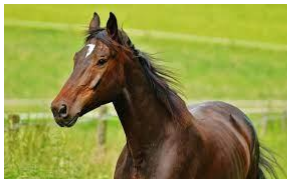
PHOTO du Cheval

definition 2 Grand mammifère (équidé) à crinière, domestiqué par l'homme comme animal de trait et de transport ; spécialement le mâle adulte (opposé à jument, poulain).