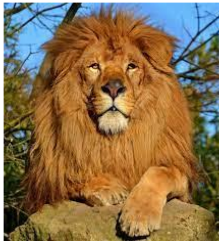
PHOTO du Lion

definition 4 Grand mammifère carnivore, à pelage fauve, à crinière, vivant en Afrique et en Asie.